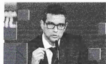
Campos Neto alerta para baixo crescimento com juros em alta.

“A Petrobras reitera seu compromisso com a prática de preços competitivos e em equilíbrio com o mercado, ao mesmo tempo em que evita o repasse imediato para os preços internos, das volatilidades externas e da taxa de câmbio causadas por eventos conjunturais”, afirmou a estatal em nota.